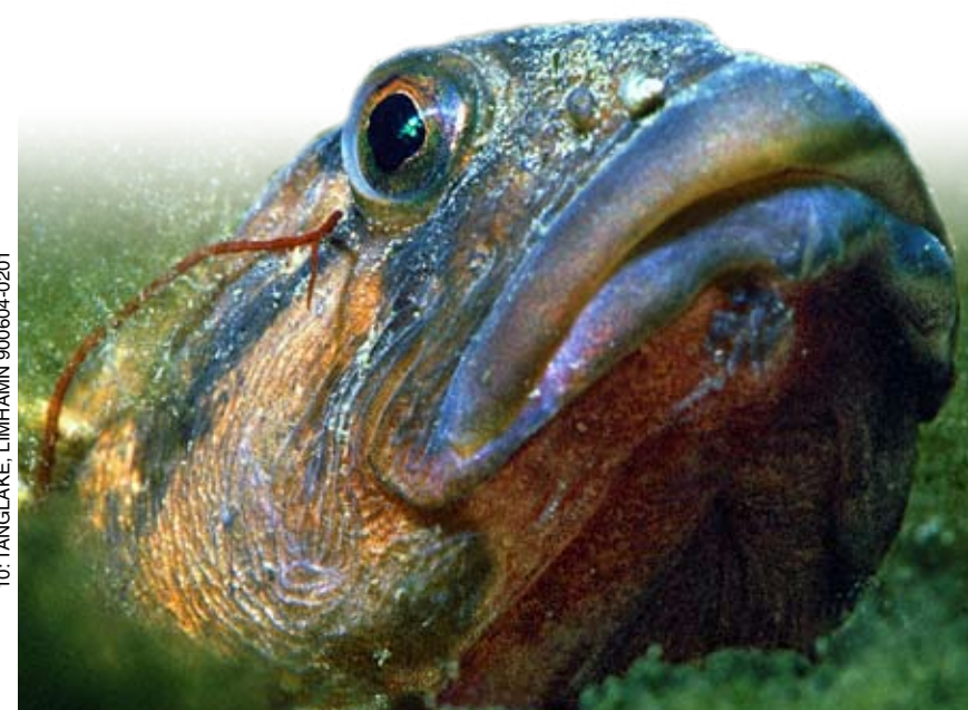
10: TÄNGLAKE, LIMHAMN 900604-0201